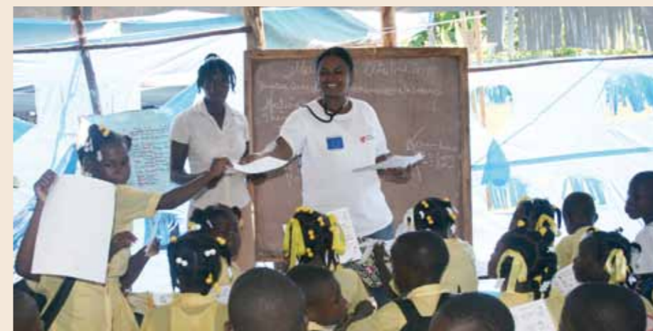
„Wie kann ich mich vor Cholera schützen?“ Aufklärungsarbeit – wie hier in einer Schule – ist lebenswichtig. | « Comment peux-je me protéger contre le choléra ? » Campagnes de sensibilisation à l'hygiène – comme à cette école – sont vitales.

J'ai déjà participé à de nombreuses missions humanitaires post-catastrophes dans différents pays. C'est le sort des enfants qui me touche toujours en particulier. Parce qu'ils représentent l'avenir de leur pays. Dans ce contexte aussi, l'éducation joue un rôle déterminant. Quand je vois ici, en Haïti, combien les enfants sont soignés, bien coiffés et bien habillés le matin pour aller à l'école, et quand je vois quels efforts sont consentis par de nombreuses familles pour pouvoir envoyer leurs enfants à l'école, il est clair que l'éducation revêt une importance énorme. Dans nos programmes scolaires, nous essayons par exemple aussi de renforcer la prise de conscience que l'éducation est un droit pour les enfants et qu'il doit leur être garanti. C'est le seul moyen de leur assurer un avenir meilleur et indépendant.