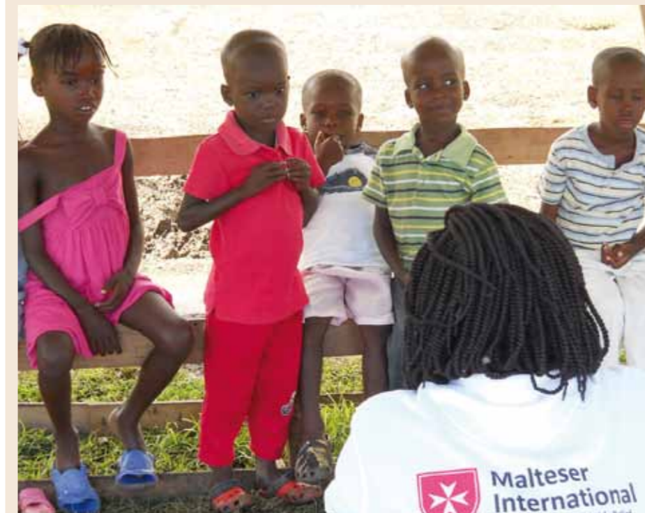
„Hände waschen nicht vergessen!“ Spielerisch lernen die Kinder richtiges hygienisches Verhalten. « N'oublie jamais de te laver les mains ! » De manière ludique, les enfants apprennent un comportement approprié en matière d'hygiène.

Art und Weise – mit Hilfe von Bällen und Spielkarten – lernten die Kinder und Jugendlichen im Alter von eineinhalb bis 18 Jahren dann etwas über die Wichtigkeit der neuen Latrinen und die Bedeutung richtigen hygienischen Verhaltens.