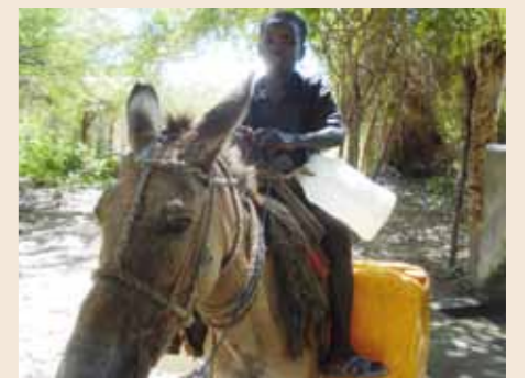
Mit dem Esel zur Wasserquelle: Über zehn km legt dieser Junge zurück, um Trinkwasser für seine Familie zu holen. | Finalement arrivé à la source : le garçon a fait plus de dix kilomètres sur l'âne pour aller chercher de l'eau potable pour sa famille.

Je leur souhaite que l'aide qui arrive actuellement dans le pays ne soit pas uniquement consacrée à l'atténuation des effets directs du séisme. Il faut également prendre en compte les besoins qui existaient déjà avant la catastrophe. Ce n'est que de cette manière que ce coup du sort peut s'avérer en fin de compte une chance pour un meilleur avenir. Et j'espère que le gouvernement du pays lui aussi utilise cette opportunité au mieux.