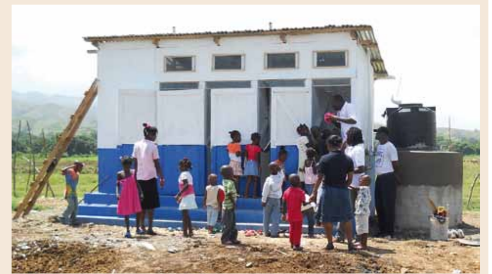
Neugierig werden die neuen Latrinen inspiziert. | Regards curieux : inspection des nouvelles latrines...

Während des Erdbebens war das Waisenhaus „L'Enfant de l'espoir“ vollkommen eingestürzt. Nun leben die 46 Waisen auf einem Wiesengelände und schlafen in einfachen Holzhütten. Die Lebensbedingungen sind stark eingeschränkt; es gibt weder ausreichend Nahrung noch haben die Kinder Zugang zu sauberem Wasser oder angemessenen sanitären Anlagen. Malteser International baute hier drei Latrinen mit integrierten Waschmöglichkeiten. Auf kindgerechte